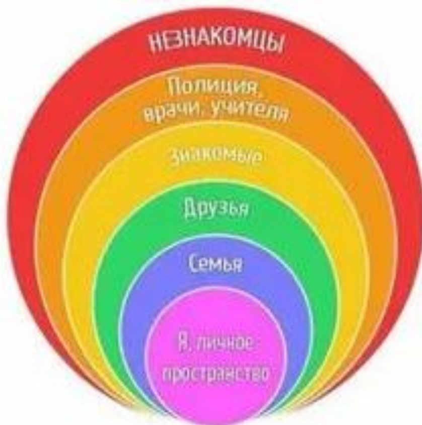
Пять кругов общения (Д. Бьюдженталь)